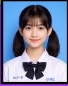
ขนาดรูป 1 - 1.5 นิ้ว