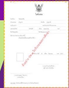
ตัวอย่าง ใบ ปพ.7