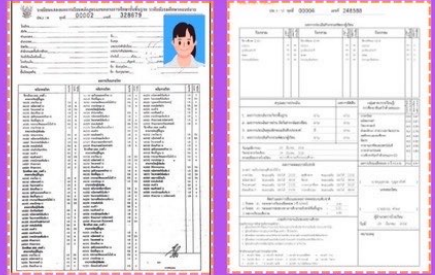
ตัวอย่าง ปพ.1 ด้านหน้าและด้านหลัง