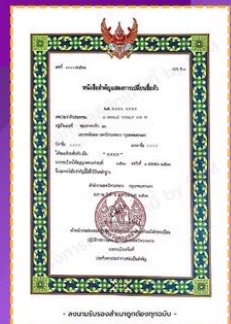
ตัวอย่าง ใบ เปลี่ยนชื่อ หรือ เปลี่ยนนามสกุล

หมายเหตุ : 1. เอกสารที่เป็นปล่าเนา ต้องรับรองสำเนาถูกต้องทุกฉบับ 2. บันทึกรูปเป็นไฟล์รูปภาพ .JPG หรือ .JPEG หรือ .PNG เท่านั้น